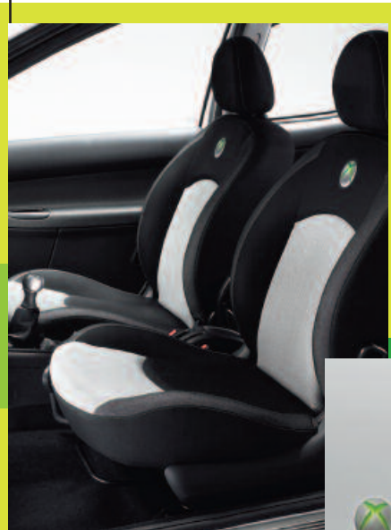
Garnissage spécifique "XBOX 360"