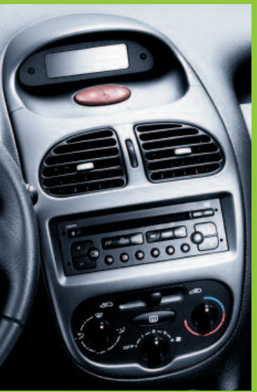
Façade technique, casquette de combiné et enjoliveurs d'aérateurs "Gris métallisé"