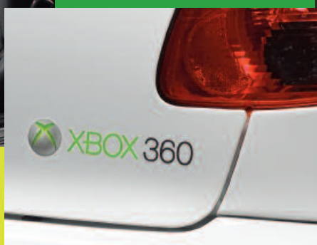
Monogramme "XBOX 360"